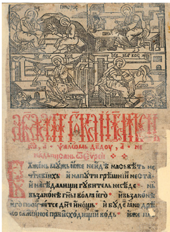
Сл. 2. Четворица јеванђелиста с натписима на грчком, Псалтир с њоследовањем , 1561. година, НБС, И 51, л. 5а