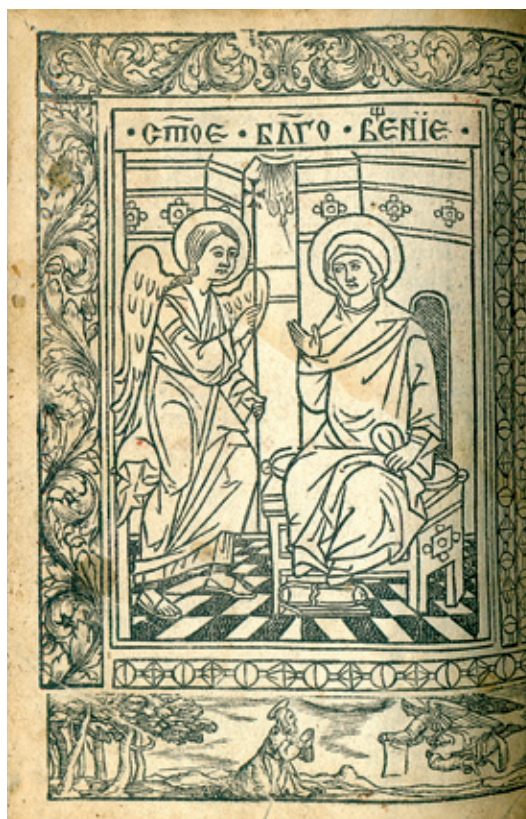
Сл. 5. Благовести; Молитва у Гетсиманском врту (доњи оквир), Молишвеник (Зборник за иуџинике), 1547. година, Руска национална библиотека, I.5.20, л. 110б

Поклоњење пастира, Обрезање, Поклоњење мудраца (Сл. 4), Сретење, Бекство у Египат, Христос подучава у храму и Христос се враћа кући после боравка у пустињи. Коначно, Христова страдања заступљена су композицијама Молитва у Гетсиманском врту (Сл. 5) и Христос и мирносице, док је једна сцена остала неидентификована (Медаковић 1958: 131; Петковић 1969: 254).