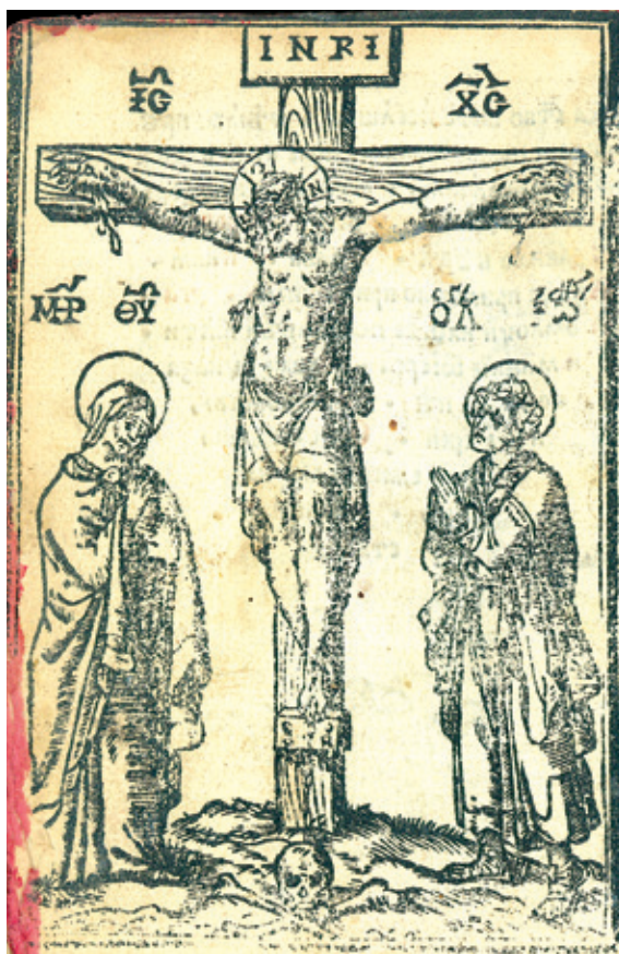
Сл. 6. Распеће Христово, Молийвеник ( Зборник за љуџнике ), 1560. година, манастир Јошаница, л. 162б