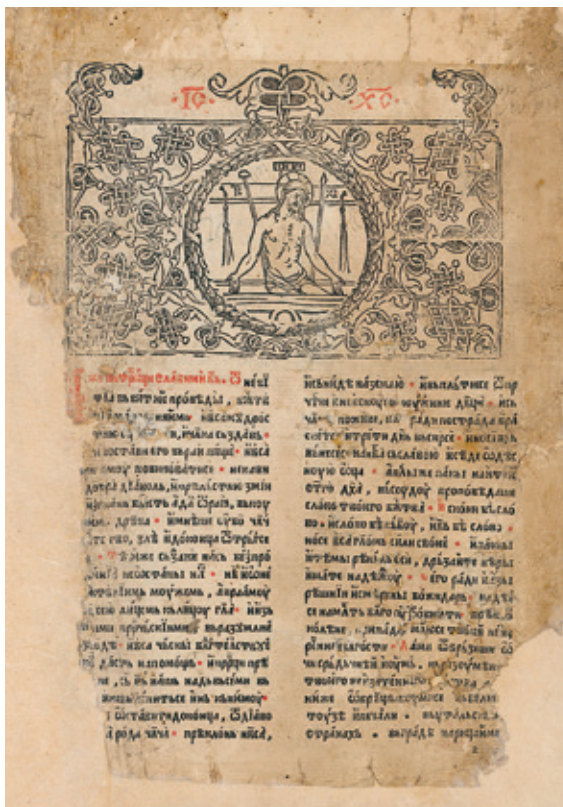
Сл. 7. Заставица с представом Imago pietatis , Окѣоих љеѣоѣласник , око 1560. године, НБС, И 5, л. 1а

У Окѣоиху љеѣоѣласнику , објављеном око 1560. године – који се према филигранолошкој анализи приписује Вићенцу Вуковићу а у којем је у потпуности поновљен и колофон издања Божидара Вуковића из 1537. године – поред приказа тројице химографа, јавља се и једна нова фигурална представа. Унутар прве заставице на листу 1а, где се раније налазио грб Божидара Вуковића, отиснута је представа мртвог Христа са оруђима страдања – Imago pietatis (Сл. 7) (Пешикан 1994: 161–162). Иако је реч о иконографском типу чији су најстарији примери сачувани у византијском сликарству XIII столећа, посредством византијских предлогака он је постао веома популаран на тлу Италије, чему су посебно допринели фрањевци и доминиканци, будући да је њихова религиозна пракса била заснована на контемплацији Христових мука, страдања и смрти (Живковић 2020: 277).