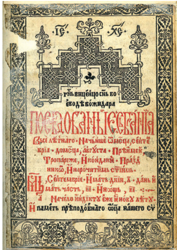
Сл. 1. Степеничаста заставица; представе Христа, Богородице и Светог Јована (доњи оквир), Псалтир с њоследовањем , 1546. година, НБС, И 15, л. 141а