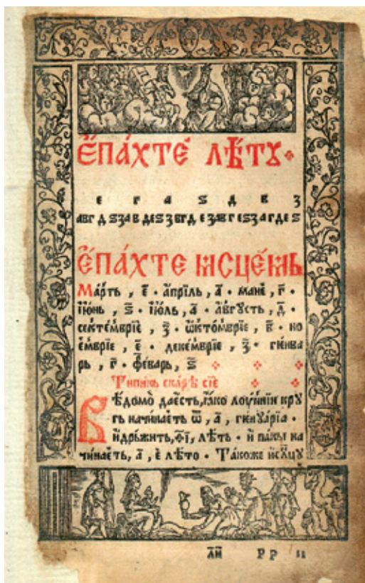
Сл. 4. Вињета с преставом Свете Тројице; Поклоњење мудраца (доњи оквир), Молишвеник (Зборник за иуџинике), 1547. година, Руска државна библиотека, № 18, л. 30ба